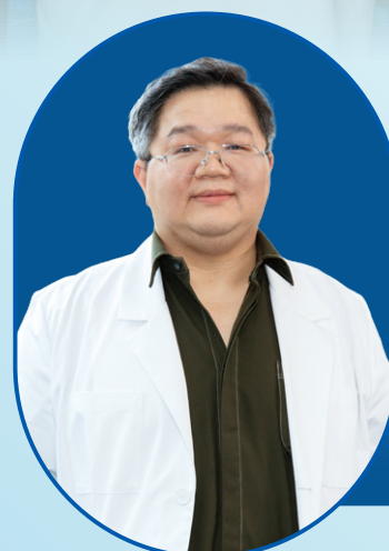
TS. BS. SU JANG WEN Chuyên gia hàng đầu Singapore về Phẫu thuật lồng ngực và Ung thư phổi

Sự hợp tác giữa Bệnh viện FV và O2 Healthcare Group đánh dấu sự khởi đầu của một làn sóng các chuyên gia hàng đầu từ Singapore đến Bệnh viện FV để cung cấp các phương pháp chẩn đoán và điều trị tiên tiến với chi phí hợp lý ngay tại địa phương.